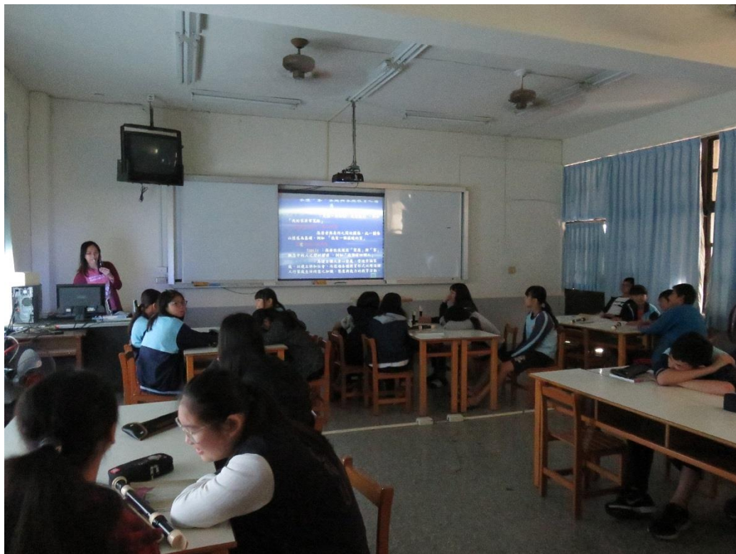
文字說明: 家庭教育對個人的重要性