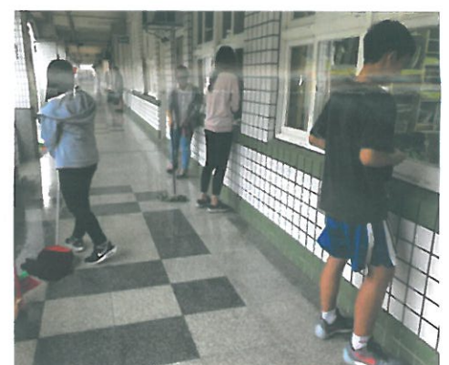
掃地時間認真打掃