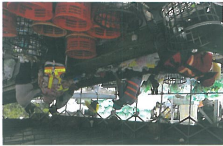
清潔隊員辛苦工作的身影