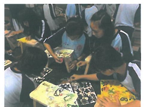
一年級社區產業初探製作天車椅