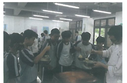
二年級職業試探體驗製作銅鑼燒