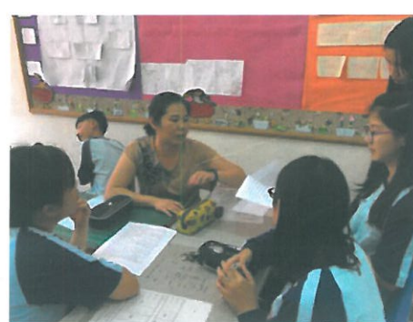
生涯小團輔上課情形