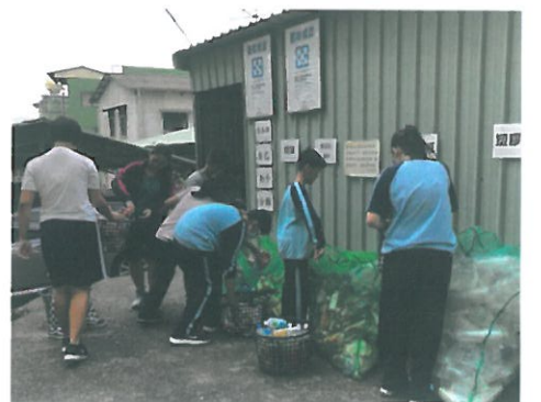
同學忙著做資源回收